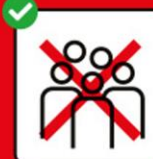
Veranstaltungen: Öffentlich max. 50 Pers. Privat max. 10 Pers. Ansammlungen im öff. Raum max. 15 Pers.