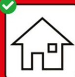
Bei positivem Test: Isolieren. Bei Kontakt mit positiv getesteter Person: Quarantäne.