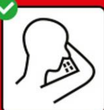
In Taschentuch oder Armbeuge husten und niesen.