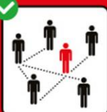
Zur Rückverfolgung Immer vollständige Kontaktlisten angeben, inkl. Taufdatum